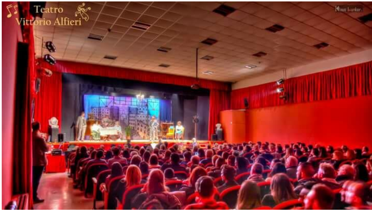
Veduta dell'interno del teatro nel corso di uno spettacolo