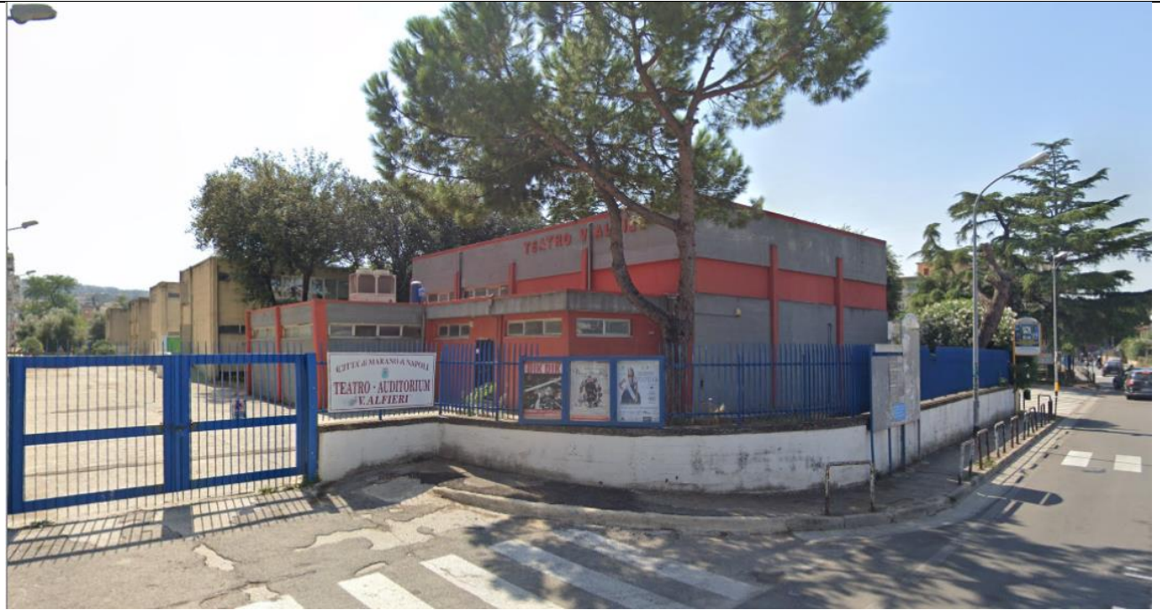
Veduta ingresso principale da via Tagliamento