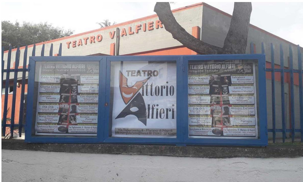
Veduta dell'ingresso del Teatro, con palinsesto stagione teatrale.

(Inserire fotografie significative dei luoghi dell'intervento)